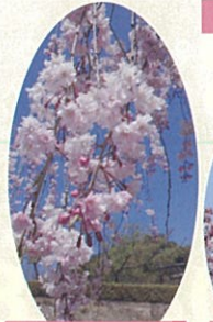
ヤエベニシダレザクラ