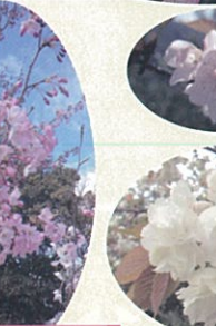
ジンダイアケボノ