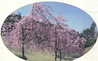
ヤエベニシダレザクラ