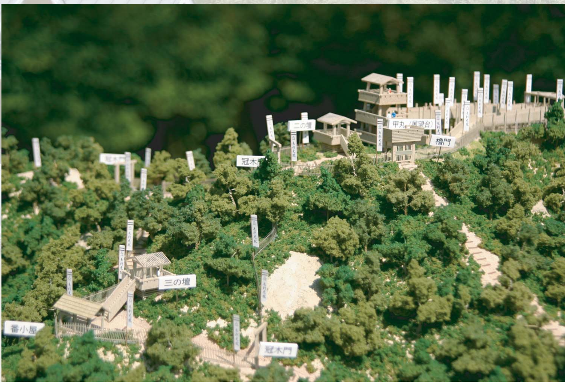
やまじろ てんぼう だい もけい 山城展望台の模型

やまじろ てんぼう だい 山城展望台からの眺め (標高 438m) なが ひろこ 合戦の地、巖島を望む!