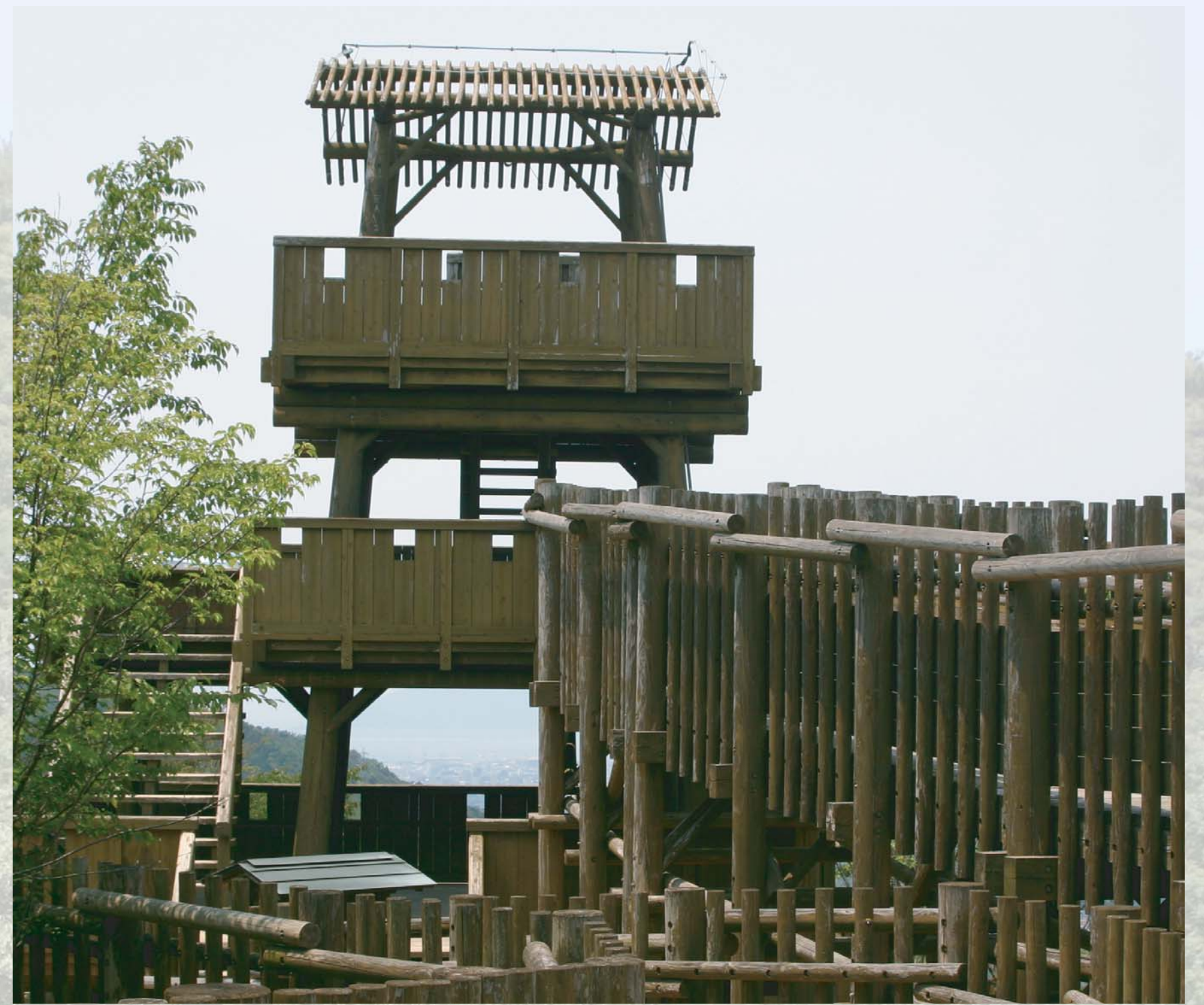
つめまる ほんまる 甲丸 (本丸)

広島城のように平野に築かれた平城が主流になったのは安土桃山時代以降とされ、元就の時代には広い水堀、高い石垣や壮大な天守はなかったそうです。